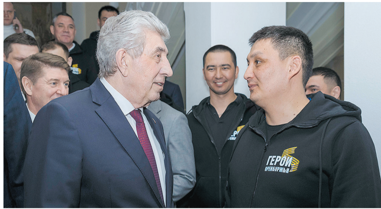
Участники СВО – в числе приглашенных на заседание Законодательного Собрания

– Россия не единственная на планете многонациональная страна. Но у нее есть существенное отличие от других – это уважение к тем народам, которые жили и живут на российской земле, уважение к их культуре и традициям, к духовным ценностям. Именно поэтому на протяжении веков базовые ценности у нас и становились общими. В истории России есть разные события, порой драматичные. Но знаковым является то, что в Смутное время именно глубинная Россия встала на защиту Москвы и общей российской государственности. В общем стремлении все сохранить: нашу общую землю, наши семьи, нашу культуру и традиции. Такое единство является самым мощным и самым сильным. Это то, что лежит в основе наших достижений